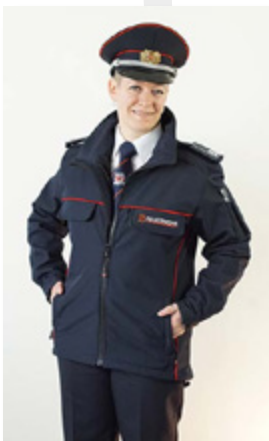
Beispiel: Tagesdienstbekleidung mit Softshelljacke