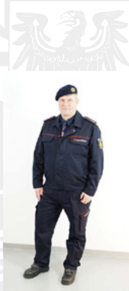
Beispiel: Tagesdienstbekleidung mit Barett