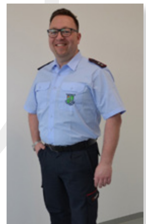
Beispiel: Sommer-Tagesdienst- bekleidung mit Kurzarm- hemd

Zusätzliche Bekleidungsstücke passend erhältlich, z.B.: